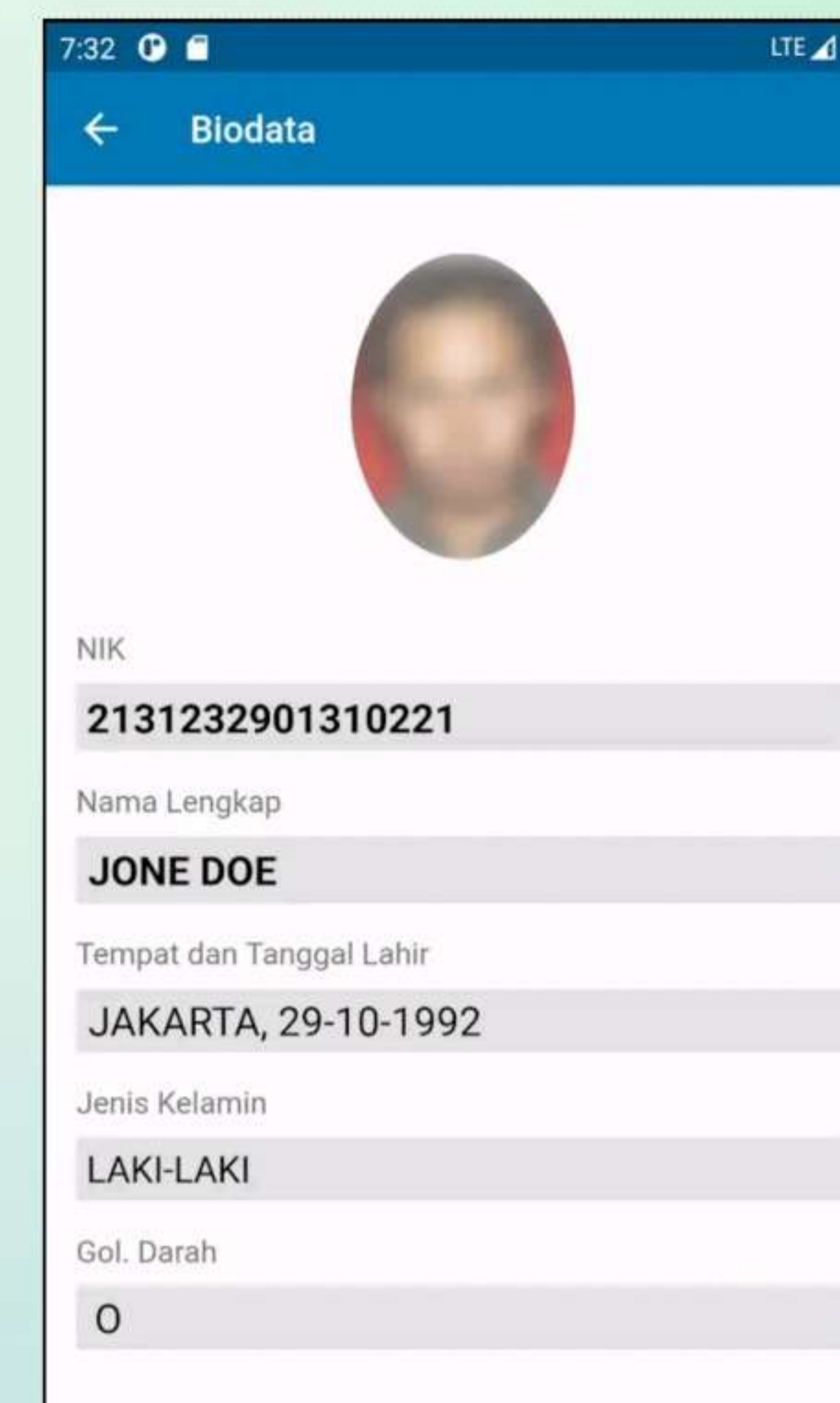
Biodata Profil atau keterangan mengenai data diri