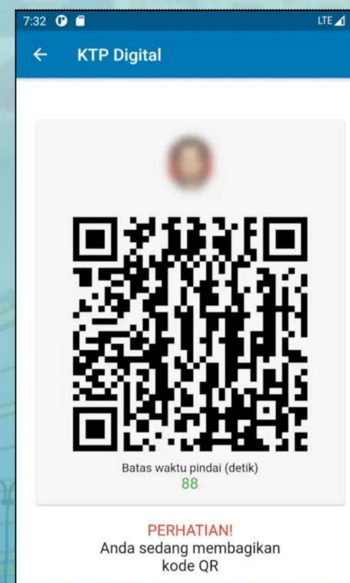
KTP Digital QR Code yang bisa dipindai