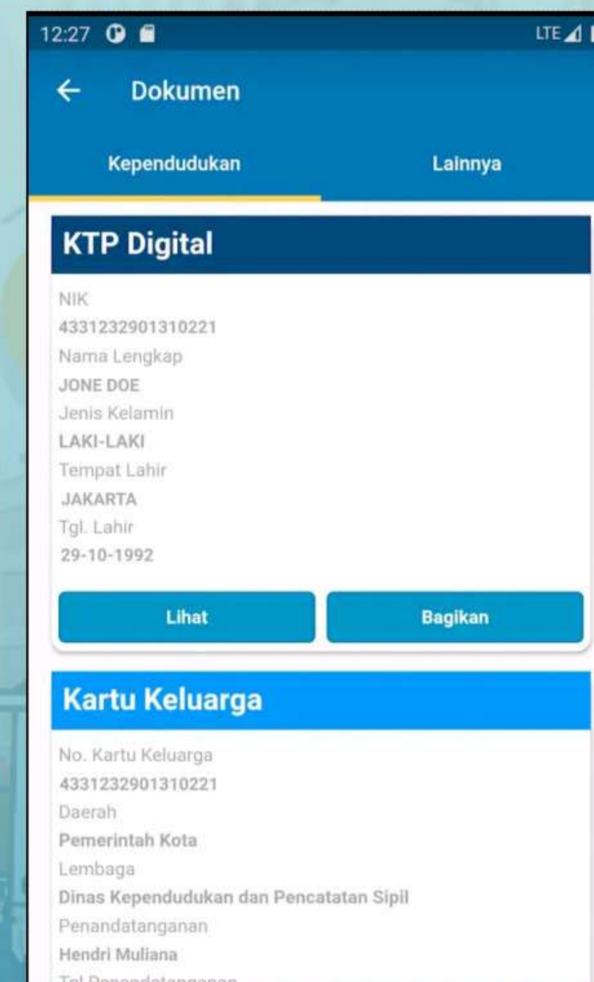
Dokumen Daftar Dokumen yang melekat pada identitas